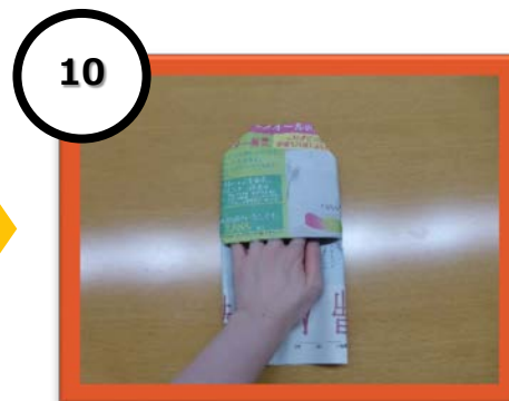
10 つま先部分の角を折る