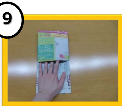
9 裏返して形を整える