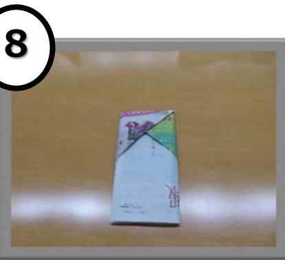
8 (差し込まれた状態)