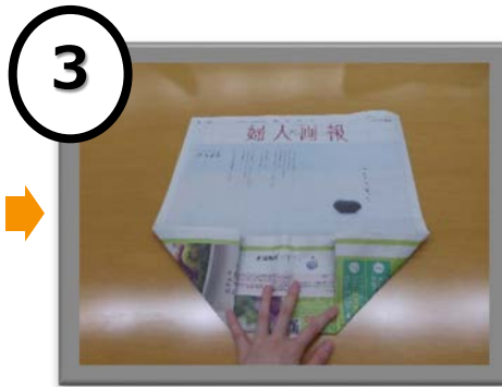
3 折った部分の左右の角を折る