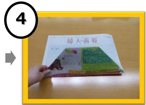
4 折った部分を起こす