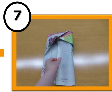
7 折った部分を反対側に差し込む