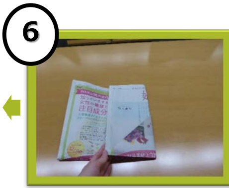
6 裏返し、横3分の1のところ、左右から折る