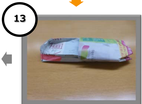
13 マスキングテープ等で止める