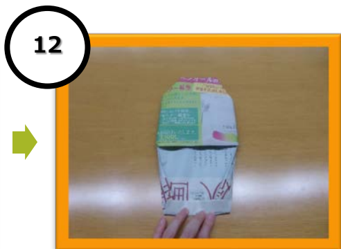
12 かかと部分を作る②