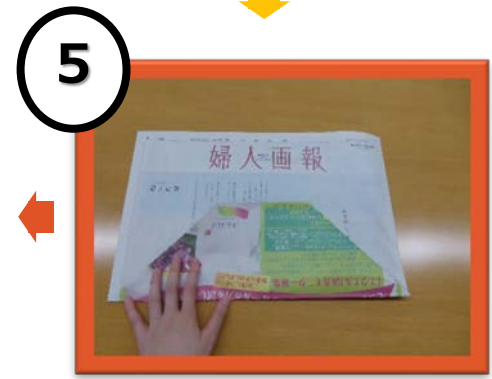
5 最初の新聞の大きさの半分のところで向こう側に折る