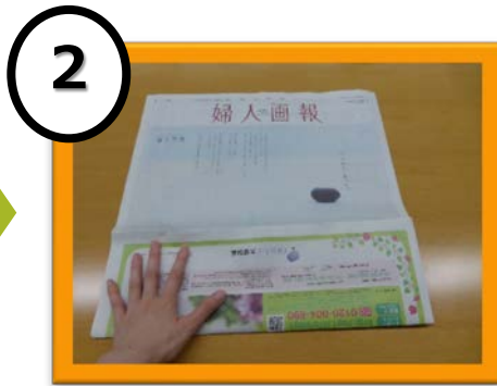
2 手前側4分の1を折る