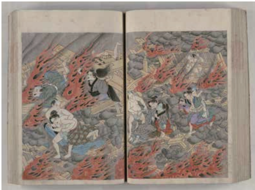
「善光寺地震で焼け出される権堂村(長野市権堂)の人々」

長野県下の図書館、文書館、博物館・歴史館等と郷土史研究者、市民等が参画し、書庫に眠る地域史料をインターネットにより市民に還元するため、平成25年にNPO長野県図書館等協働機構を設立。平成25年度より長野県下の図書館等が所蔵している地域史料のアーカイブ事業を推進し、現在約200タイトルの地域史料をアーカイブし、ネット提供しています。