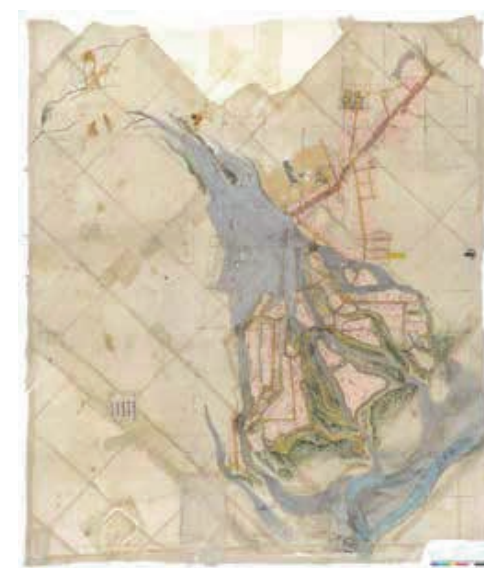
「寛保二年小諸大洪水変地絵図」(戊の満水関係)