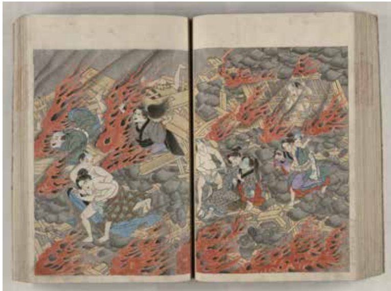
「善光寺地震で焼け出される権堂村（長野市権堂）の人々」